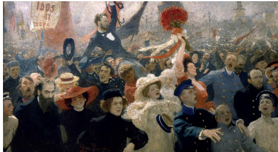
Ilya Répine, Le 17 octobre 1905 , 1907 retouché en 1911 Huile sur toile